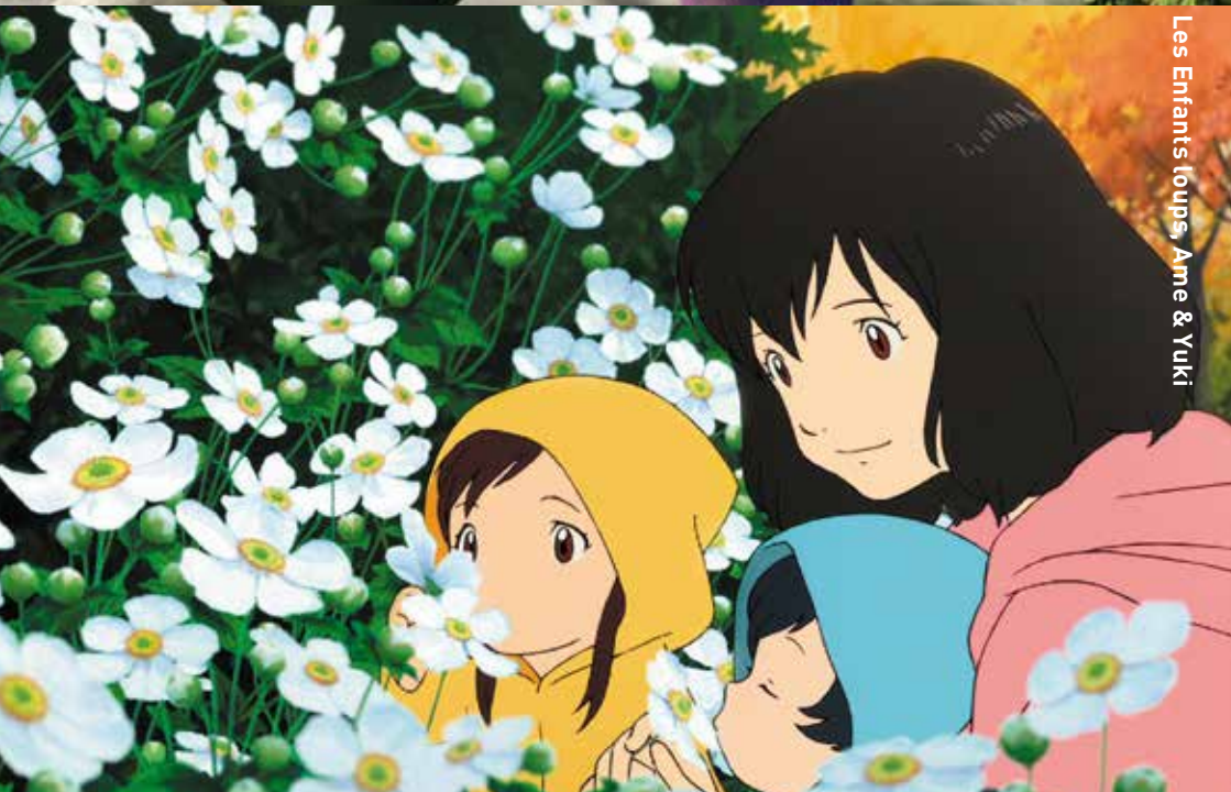
Les Enfants loups, Ame & Yuki