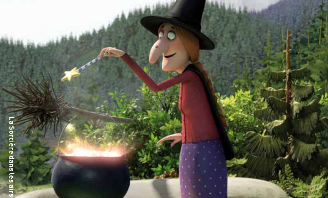
La Sorcière dans les airs