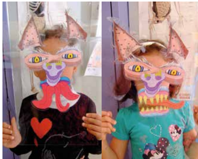
Des animations réjouissantes après la vision du Griffalo !

Toute reproduction interdite sans l'autorisation des auteurs (Michel Condé, Vinciane Fonck, Florence Leone, Anne Vervier).