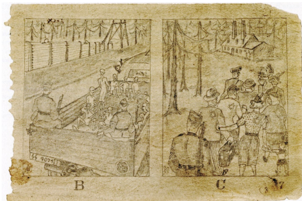
Ci-dessus un page de dessins extraite du Carnet de croquis d'Auschwitz

Ce carnet fut probablement réalisé en 1943 par un détenu qui a voulu témoigner, au péril de sa vie, des différents aspects du camp d'Auschwitz. Il a été enterré dans les fondations d'un baraquement de Birkenau où il a été retrouvé en 1947. Il est aujourd'hui conservé au Mémorial d'Auschwitz. L'auteur resté inconnu est vraisemblablement mort.