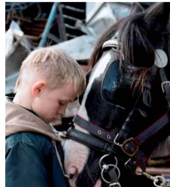
Ан Вервие Културен център „Ле Грину“

на скрап процъфтява; цените на металите се повишават; наблюдава се нарастване на безработицата и все по-силно обедняване на семействата в някои райони на Европа), в който защитата на човешките ценности е силно необходима.